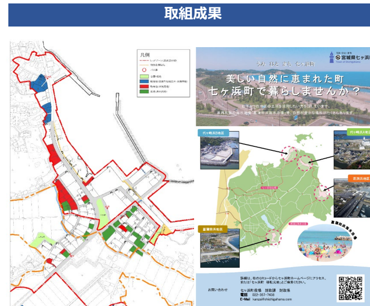
地区別土地情報図