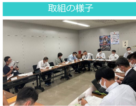
庁内情報共有会議