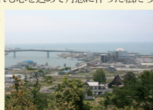
▲日和山から見た旧北上川河口

ご支援くださった皆様にこの感謝の気持ちと、石巻の美味しい海の幸をぎゅっと詰めてお届け致します。どれも心を込めて丹念に作った私たちの自信作です。是非ご賞味ください。また、私たちはより良い製品を作るための努力は惜しみません。商品でなにかお気づきの点がありましたら、ご意見をいただければ幸いです。