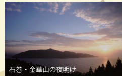
石巻・金華山の夜明け

みちのく宮城第二の都市である、石巻市。市内には石巻ゆかりの故・石ノ森章太郎先生の作品を展示するマンガミュージアム「石ノ森萬画館」をはじめ、見どころがいっぱい。また最高の名物は、世界三大漁場・金華山沖から水揚げされる多様多彩な海の幸です。