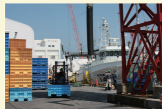
▲活気を取り戻しつつある石巻魚市場

震災から2年以上が経過した現在、石巻市民の不屈の精神で復旧が進んでおりますが、未だ復旧の目途がたたず再開にいたっていないところも見受けられます。