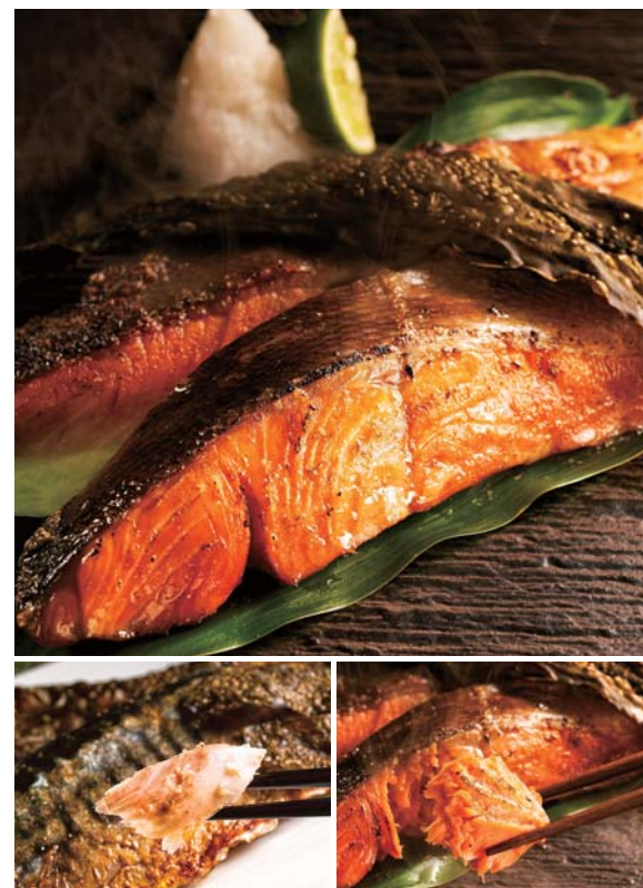
(上)昆布の風味が銀鮭の旨味を一層引き立てる (下左)サバの塩麹漬は昆布に加え7種の特製出汁粉をまぶした香ばしさがたまらない逸品