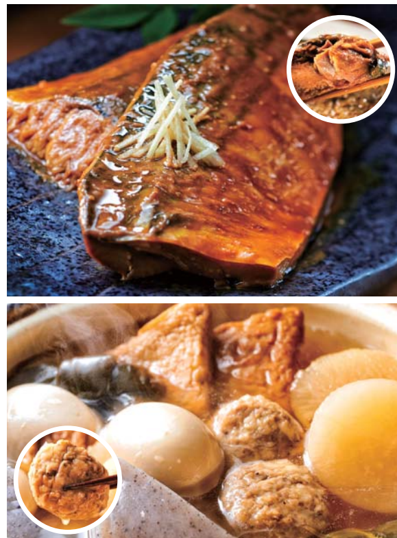
(上)サバの煮込みは味噌煮と生姜煮の2種 (下)牛たんつくねのおでんの出汁は、かつおぶしや昆布だけのこだわり天然スープ ※おでんの写真は絆・牛たんつくね2パック分

※7大アレルゲン[卵、小麦、牛乳、そば、落花生、えび、かに]について含有しているものを記載しています。 ※漁獲状況によっては出荷できない場合がございます。季節によって内容が異なる場合がございます。予めご了承ください