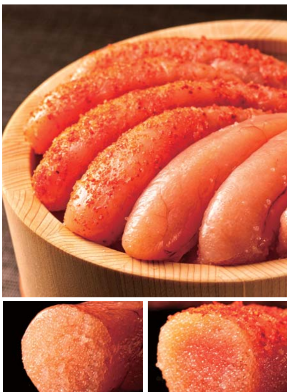
(下左)たらこの断面を見ればわかるように粒の密度がちがう (下右)明太子の漬け汁は中心までしっかり染み込んでいる