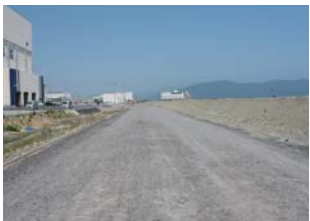
現在の魚市場周辺：未だに道路が未舗装