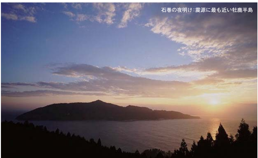
石巻の夜明け：震源に最も近い牡鹿半島

き、生産者に元気を与えていただきたい。それが、「石巻・海のごちそう便」の目的です。