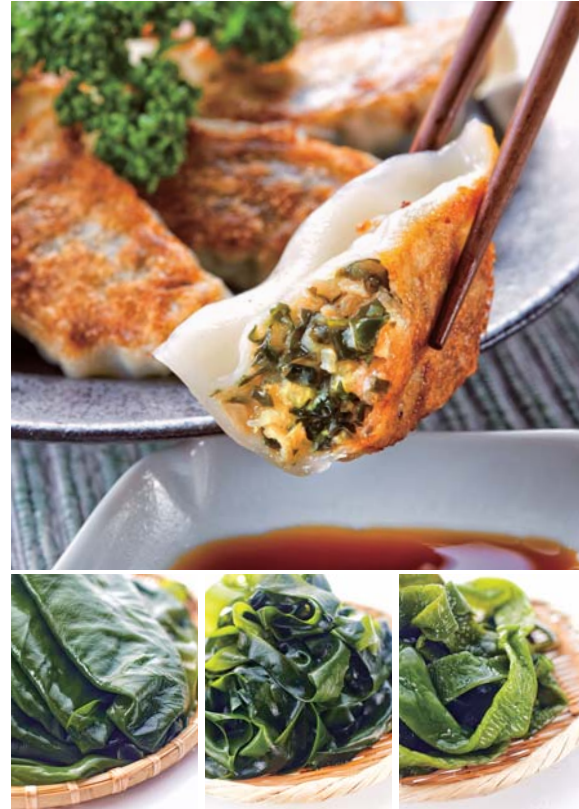
(上)餃子には三陸十三浜のワカメがたっぷり。存在感のある歯ごたえも特徴 (下)ワカメと昆布はどれも眩いほどの新鮮な緑色

[7大アレルゲン]なし [食品添加物]調味料(アミノ酸等) [賞味期限]冷凍30日