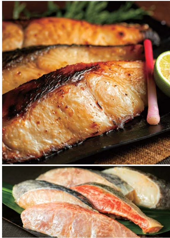
(上)西京焼きの表面は銚色に輝き表面はバリバリ、中はジューシー (下)全5種の本漬けセットなので家族で違う味を楽しめる

求めたのは味の多重奏。 海の幸を絶品の 本漬けに 奥の風(高徳海産) 美味しい西京漬けと粕漬けの決め手、それは良質な「素材」と惜しみない「手間」。2種の本漬けには京都の老舗に分けていた、京白味噌や、米どころ新潟や宮城の酒蔵の奈良粕を使用。一切れ一切れ丹念に、数日間漬け込むと、魚本来の美味しさに得も言われぬ風味と甘さ、そしてコクがじんわりと染みこんでいくのです。ふっくら焼きあがった銚色の身をぜひ堪能ください。