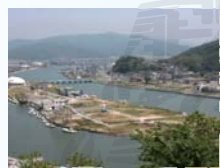
▲日和山から中瀬方面