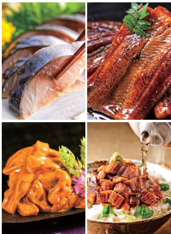
(左上)金華ダサバの身は透き通るように美しく引き締まっている (下左)無添加でありながら黄金色に輝くほど新鮮なイカ塩辛はお酒の肴としても人気がある (右上)煮穴子はそのまます非。驚くほどの柔らかさを堪能ください (下右)刻み穴子をご飯にのせてお茶をかけた後に山椒をふればお酒のシメに最適