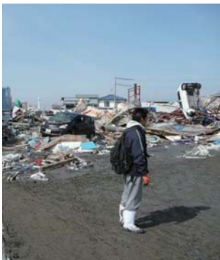
震災直後の石巻：大事な財産が“ガレキ”に

復旧の目途がたらず再開にいたっていないところも見受けられます。石巻漁港では、平成23年7月に水揚げが再開し、11月には仮設の荷捌き場が完成。水揚げ機能は回復してきまし