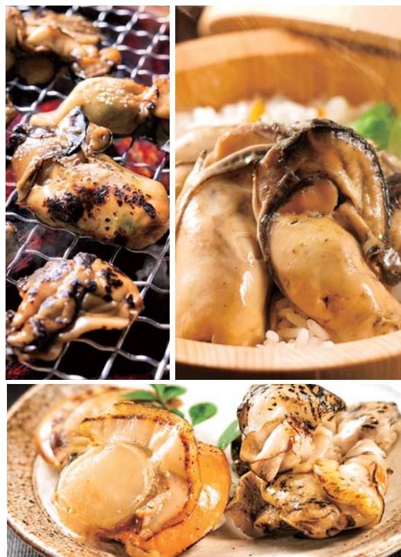
(上右)潮煮は煮汁とともに牡蠣ご飯におすすめ (下)牡蠣だけでなく、ホタテやつぶ貝も素材のエキスだけで煮込んでいます

300g(無着色たらこ150g、無着色明太子150g) 【7大アレルゲン】なし 【賞味期限】冷蔵60日