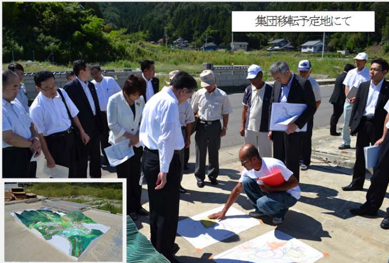
集団移転予定地にて