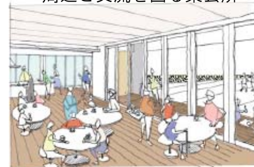
内外一体利用出来る集会所