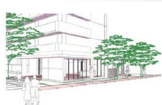
周辺と交流を図る集会所