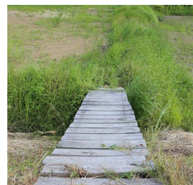
避難から5年5か月後 H28.8.12