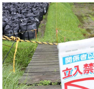
避難から4年5か月後 H27.8.13