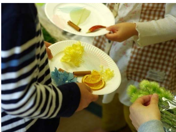
村外に住む住民も参加した交流事業。ハーバリウムを一緒に作りました。

現在は私たちの上の世代の方が一生懸命、飯舘村の村づくりを行っています。飯舘村の歴史を見ても、村づくりの精神は次の世代、またその次の世代へと受け継がれてきました。私たち40代・50代の世代が中心的な役割を担う時が必ずくると思います。その時すぐに動くことができるように、村民同士のネットワークを作りながら、飯舘村の将来について今から考え、動いていきたいと思っています。