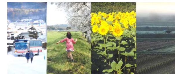
飯舘村の未来を考えるためのデータブック