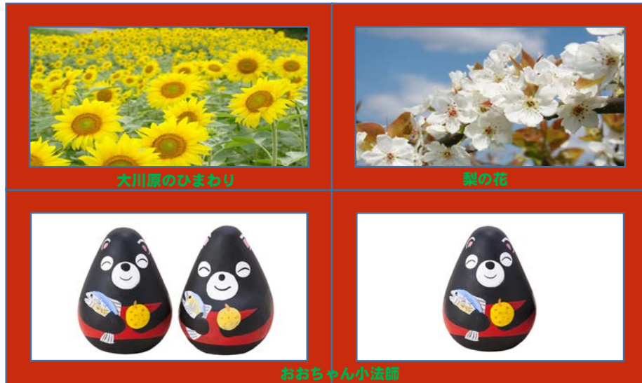
大川原のひまわり

平成28年9月7日に、国立研究開発法人 日本原子力研究開発機構（JAEA）が建設予定の分析・研究施設について、工事の安全祈願祭と起工式が開催されました。