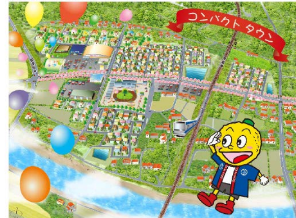
【コンパクトタウンの完成イメージ】

商業・医療を始めとする日常生活のサービス機能や住宅等を集約し、利便性が高く、賑わいのある新たな街並みを形成するため「コンパクトタウン」を整備しています。